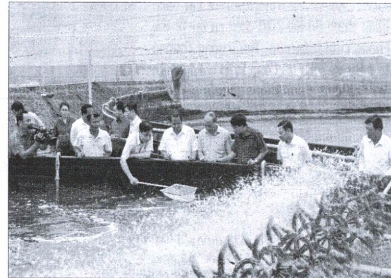
Tham quan một mô hình xử lý nước thải nuôi tôm bằng biogas

phân tôm thải ra hàng ngày, thông thường 10m 3 hầm chứa biogas sẽ chứa được lượng phân của 100 nghìn con tôm. Lắp đặt biogas phải đúng quy trình kỹ thuật (lưu ý lắp đặt đồng hồ báo áp suất gas để tránh áp suất gas lớn sẽ gây nguy hiểm). Thiết bị dụng cụ lắp đặt biogas phải mua ở những nơi có uy tín và đảm bảo chất lượng để tránh hiện tượng rò rỉ khí gas gây nguy hiểm khi sử dụng.